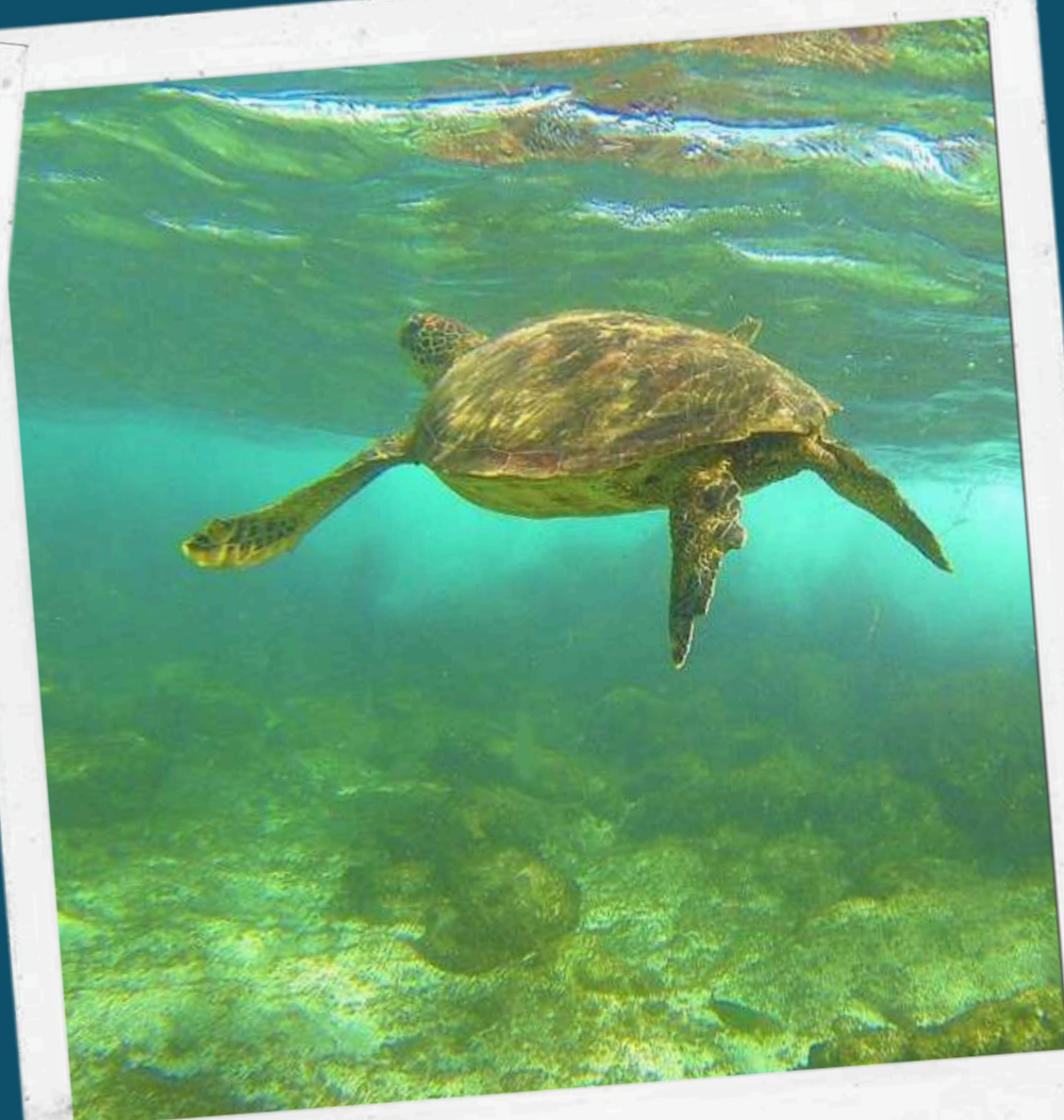
SNORKEL CON TORTUGAS