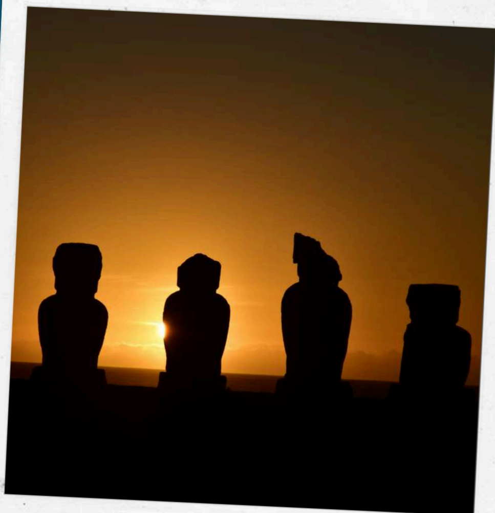
PUESTAS DE SOL