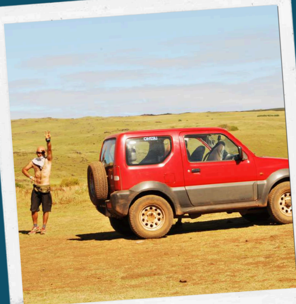
PASEOS EN 4X4