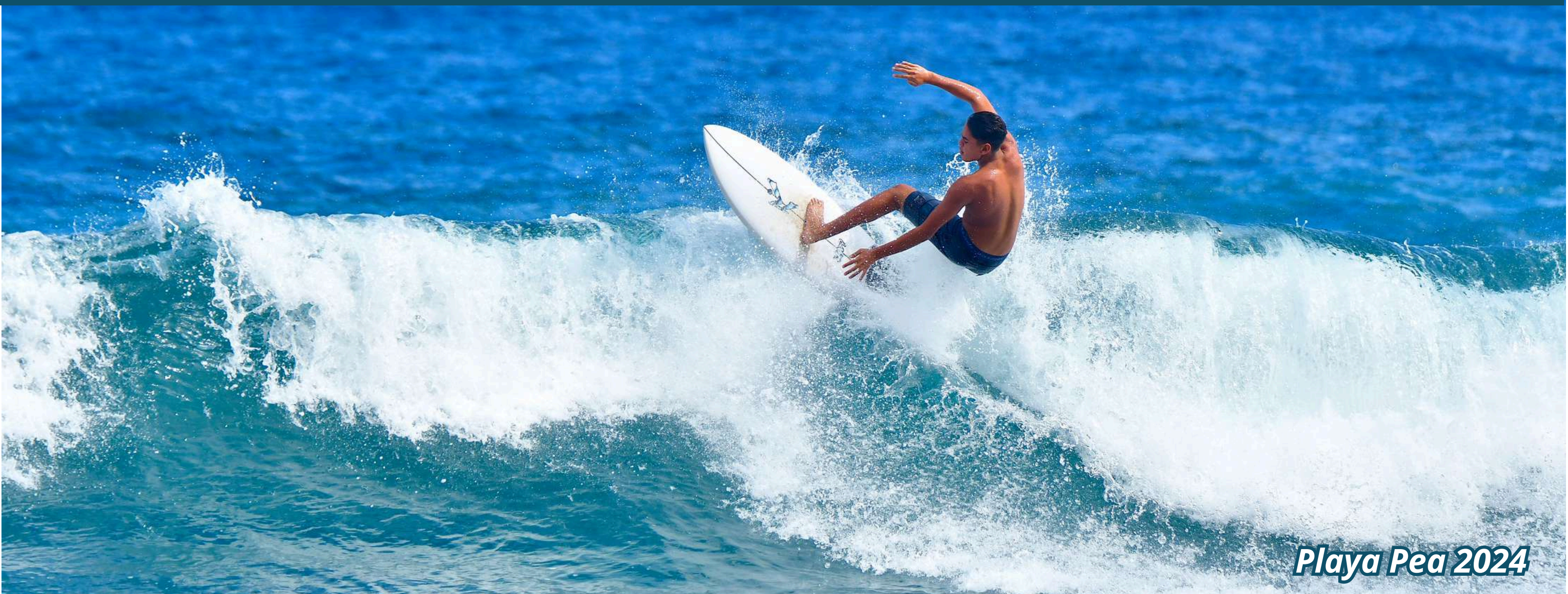
Playa Pea 2024

Nos vamos de viaje a Isla de Pascua, volaremos por un poco más de 4 horas los 3.800 kilómetros de distancia que nos separan del continente para llegar a surfear y conocer las olas de la calata Hanga Roa, las que llenas de energía y misticismo te sumergerán en un sin fin de emociones que te harán sentir como nunca antes ya que, junto a su mar potente, cristalino y de temperatura muy agradable (puedes surfear solo con traje de bajo o traje 3.2 mm) estarás en contacto directo con peces de colores, corales y tortugas por doquier.