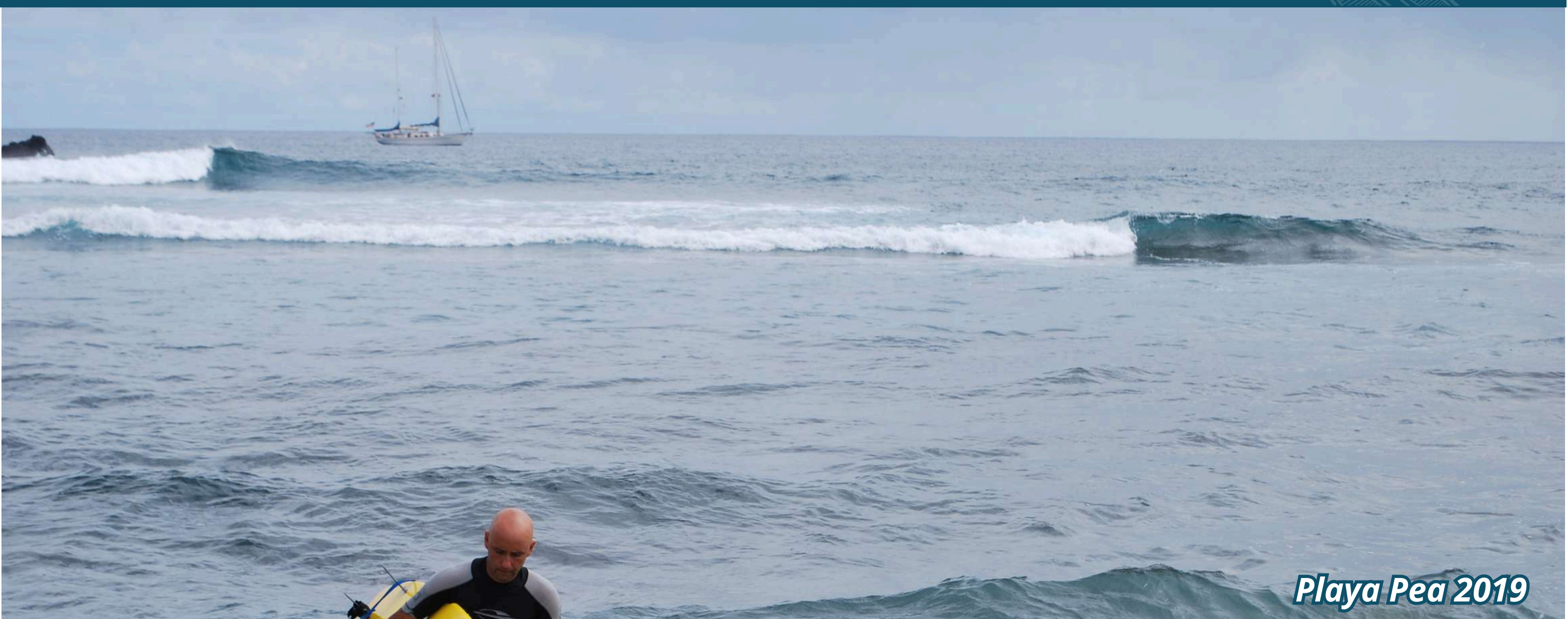
Playa Pea 2019