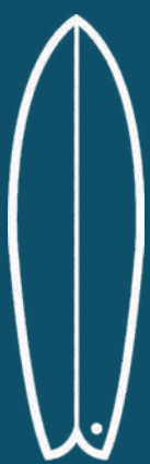
Tabla de Surf. Puede ser una tabla de cualquier medida hasta 7,10, según lo que te guste surfear. Llevaremos todas las tablas en nuestras fundas dobles o triples, por lo que te recomendamos que traslades tu tabla hasta en el aeropuerto solamente en una funda tipo calcetín o envoltorio de burbujas. si no tienes tabla o no quieres llevar la tuya, podemos arrendarte una alla, los días en que tengamos programados las sesiones de surf.