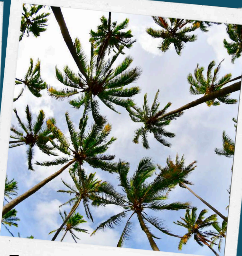
TARDES DE PLAYA